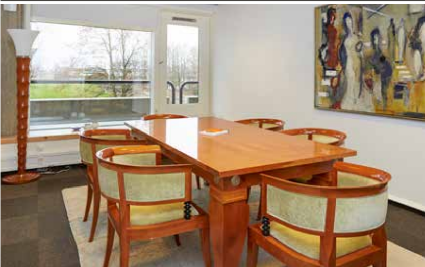
Milano 6 personer