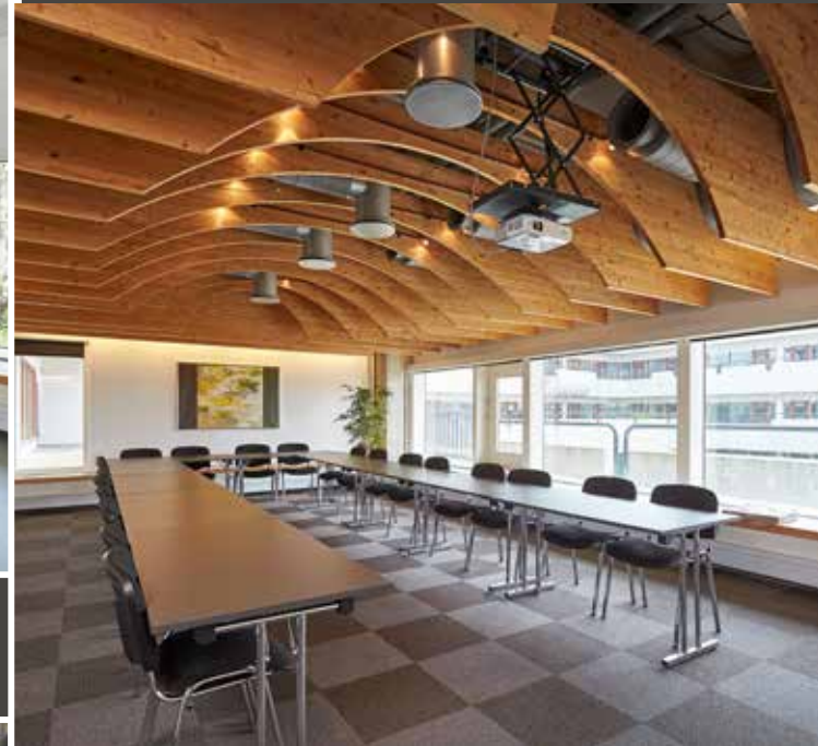
Vancouver 36 personer