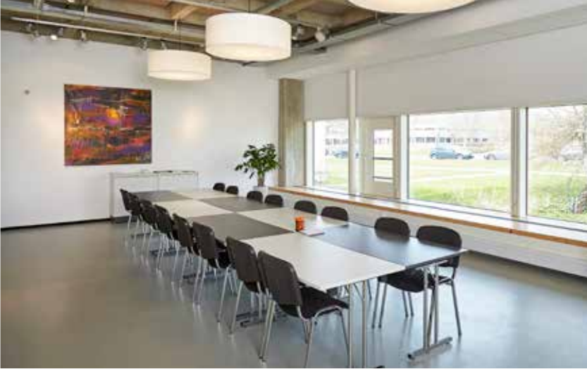
New York 16 personer