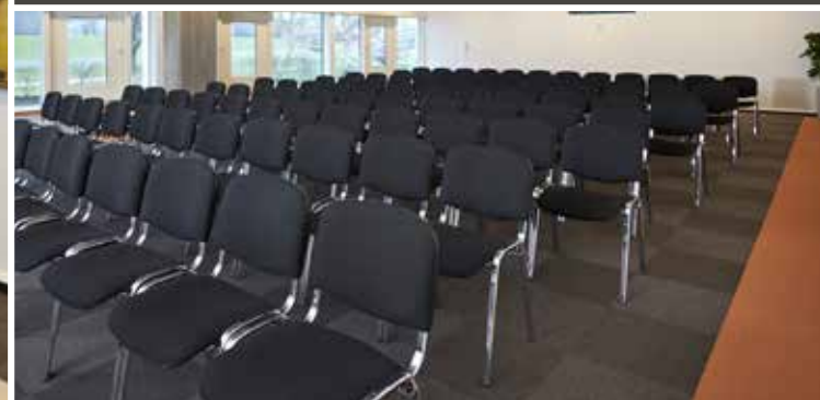
Paris Auditorie med plads til 150 personer